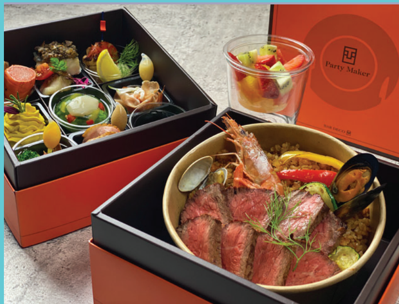
*写真はイメージです。(季節により内容は変わります。)