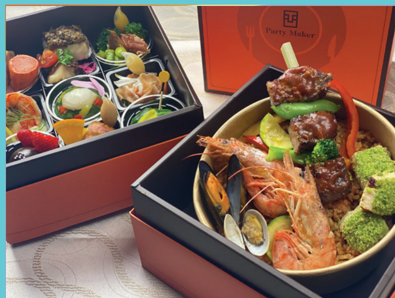
*写真はイメージです。(季節により内容は変わります。)

前菜からデザートまで詰め込まれたコース仕立てのボリュームミーな内容となっています。