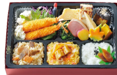
味三昧(あじざんまい) 1,188円