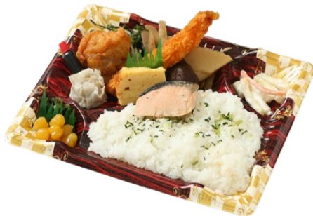
和風幕の内弁当 700円