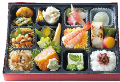
十二単(じゅうにひとえ) 1,620円