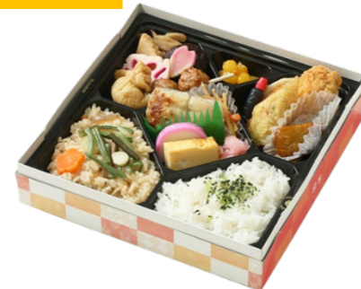
2色ご飯幕の内弁当 1,000円