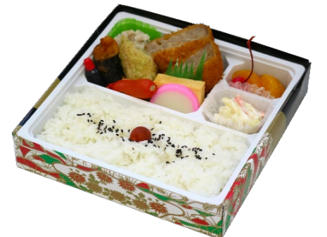
メンチカツ弁当 756円