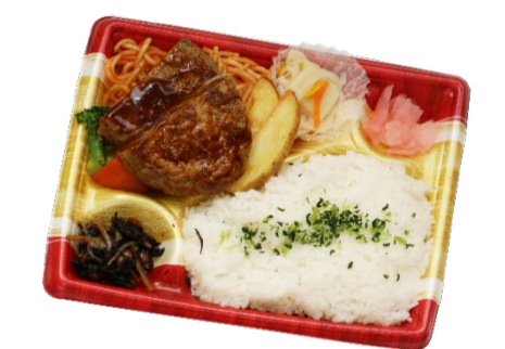
デミハンバーグ弁当 648円