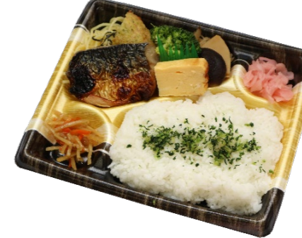
鯖の照り焼弁当 648円