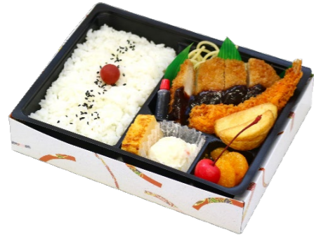
ローズみそカツ&エビフライ弁当 864円