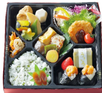
尾張御膳(おわりごぜん) 1,620円