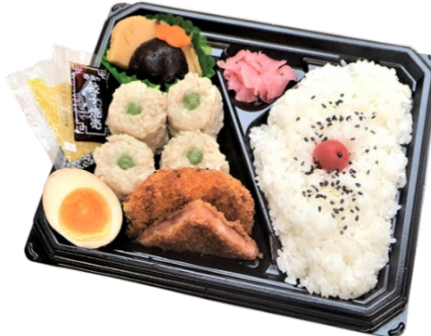
昔ながらの焼売弁当 648円