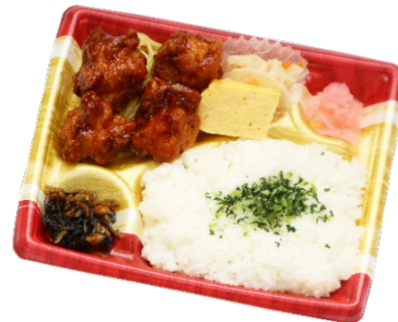
黒酢から揚げ弁当 648円