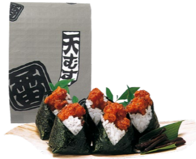
天むす 5個入 820円