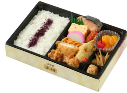
チキンカツ&竜田揚げ弁当 950円