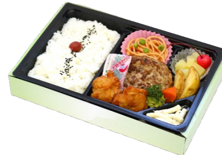
ハンバーグ&から揚げ弁当 864円