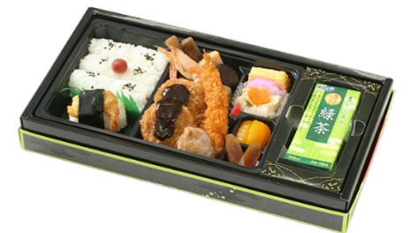
ひざのせ名古屋名物御膳 1,296円