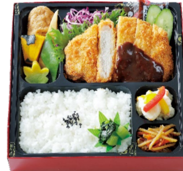
熟成ロースとんかつ弁当 1,188円