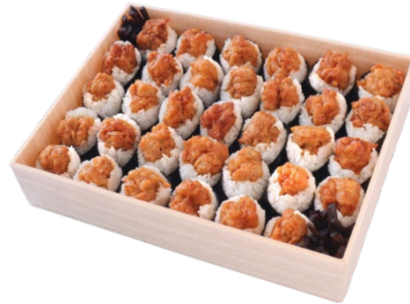
天むす 33個入 5,417円