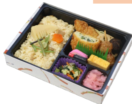
春のてまり弁当 756円