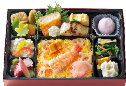
ちらし寿司弁当 1,404円